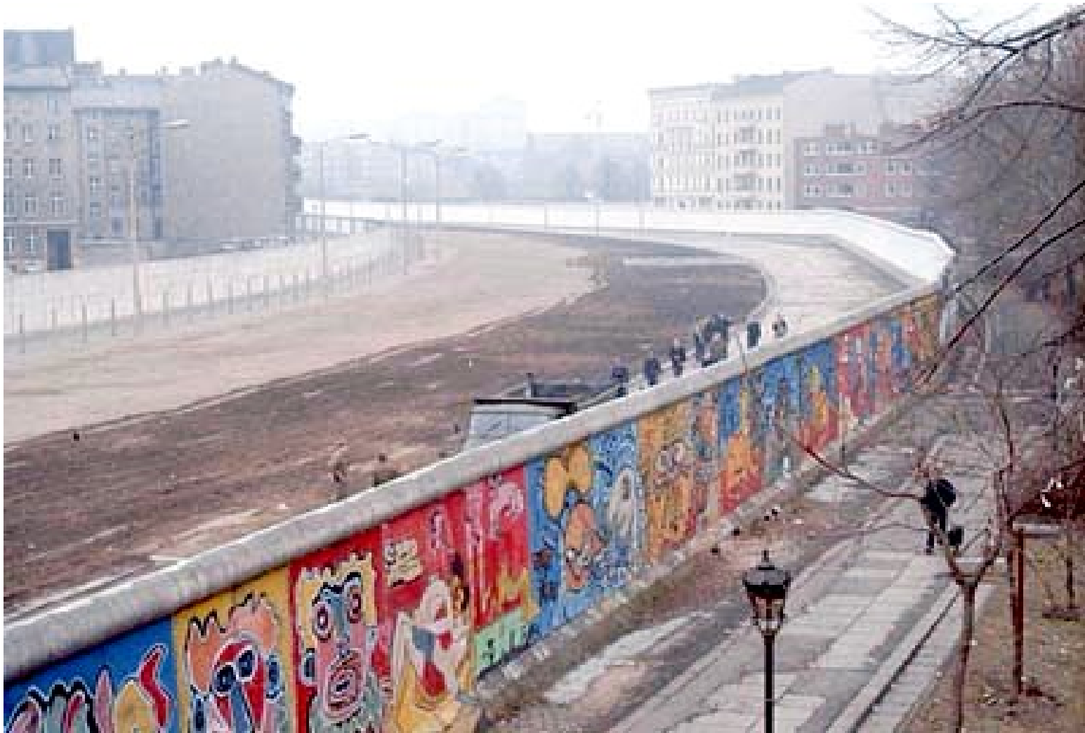
Mur de Berlin vue par l'Ouest