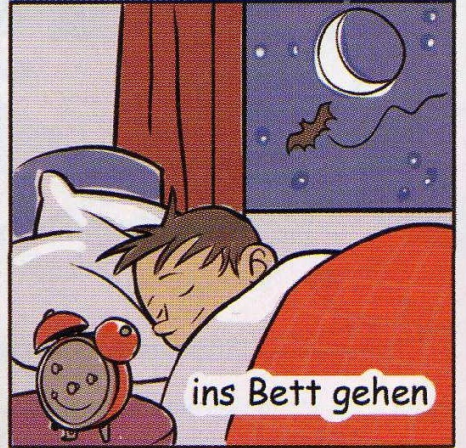
ins Bett gehen