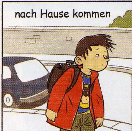
nach Hause kommen