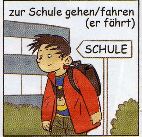
zur Schule gehen/fahren (er fährt)