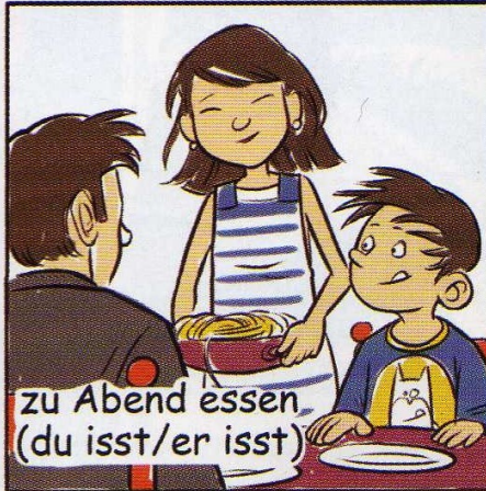
zu Abend essen. (du isst/er isst)